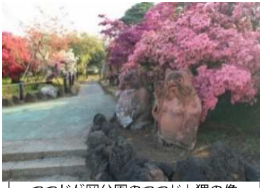
つつじが岡公園のつつじと狸の像

近代化によって少しずつ姿を消していった里沼。しかし、館林には今も沼と人々が共存する景色が残されています。